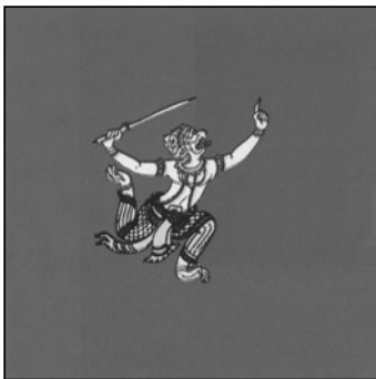
ธงชัยราชกระบี่ธูชน้อย