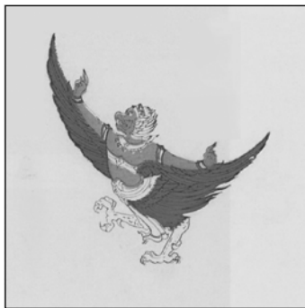
ธงชัยพระครุฑพ่าห์น้อย