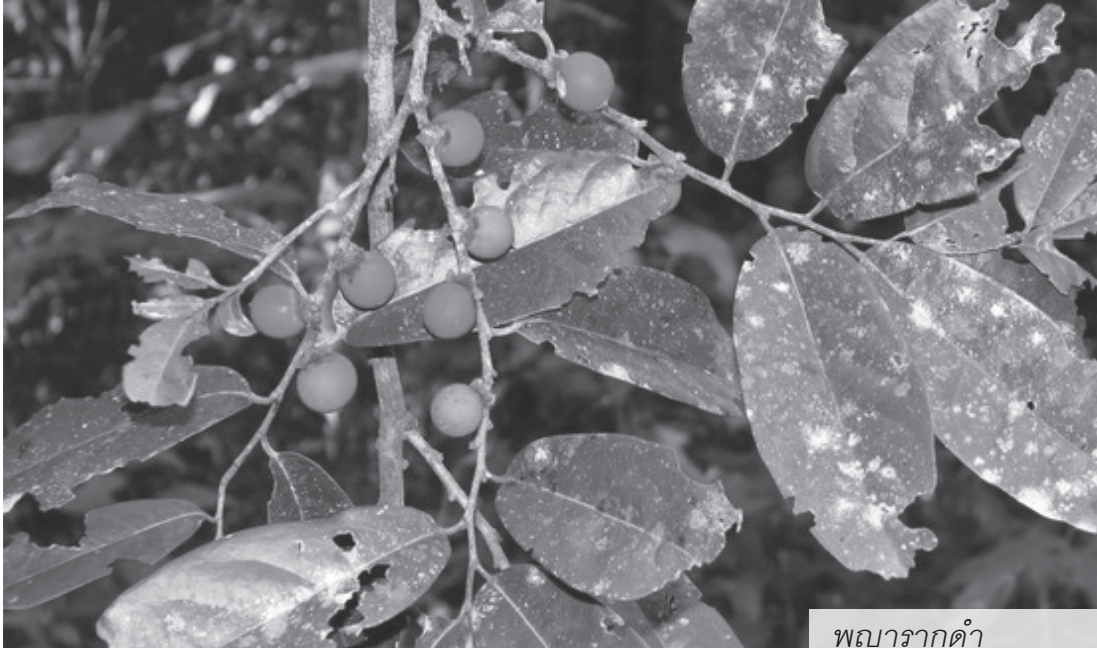
พญารากดำ