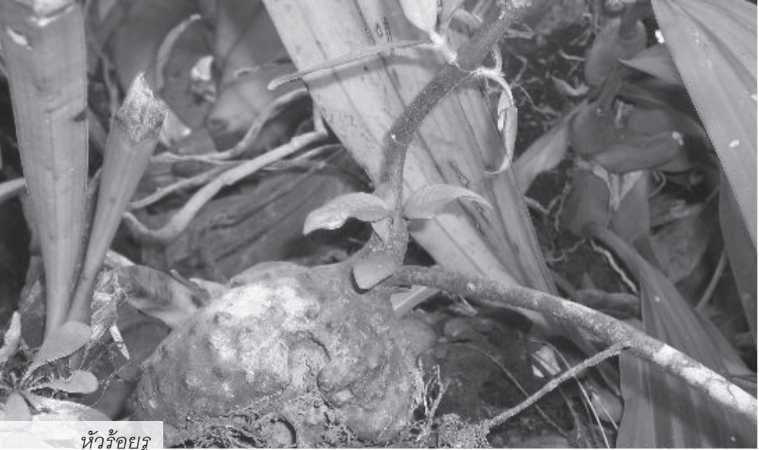
หัวร้อยรู