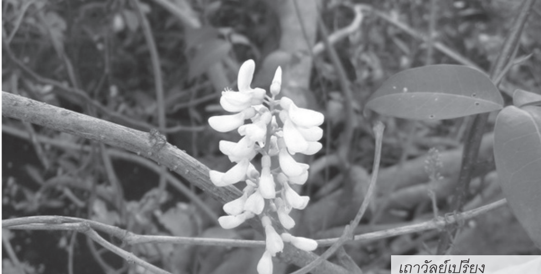
เถาวัลย์เปรียง