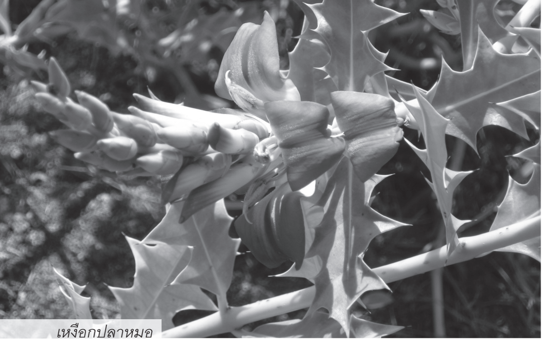
เหงือกปลาหมอ