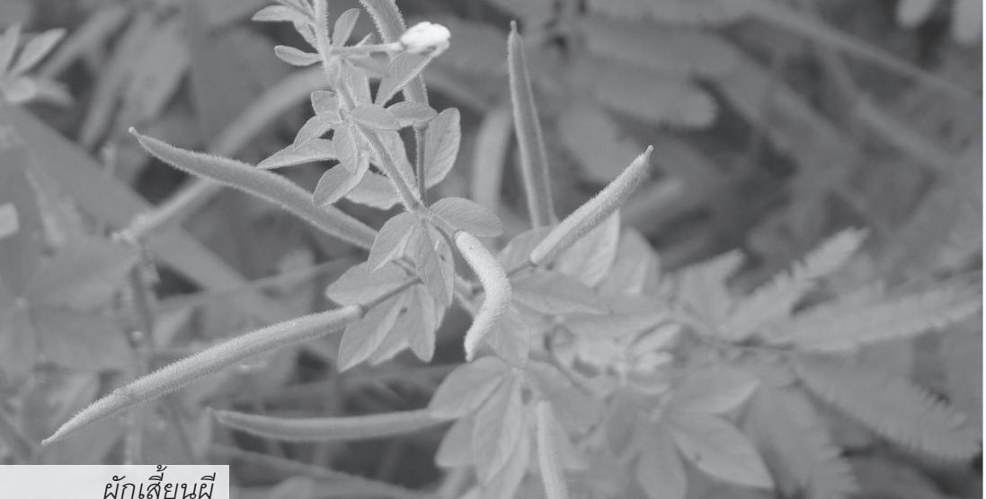
ฝักเลี่ยนผี