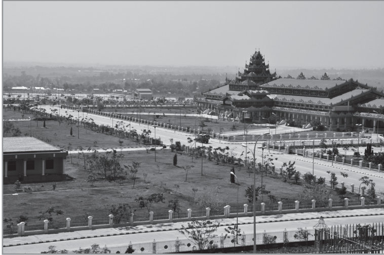
เนปิดอว์ เมืองหลวงใหม่ของเมียนมาร์

รัฐบาลเมียนมาร์ ภายใต้การบัญชาการของกระทรวงกลาโหม เมียนมาร์ได้ย้ายเมืองหลวงเมื่อ ค.ศ. 2002 จนสำเร็จ และมีการเฉลิมฉลองเมืองหลวงใหม่ เมื่อวันที่ 27 มีนาคม 2006