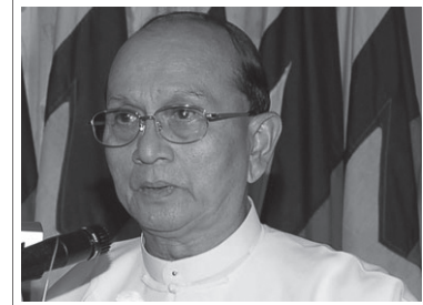
นายเต็ง เส่ง ประธานาธิบดีพลเรือนของเมียนมาร์ ผู้พัฒนาแนวทางประชาธิปไตย

Burmese way to Socialism) ซึ่งมีต้นแบบมาจากสหภาพโซเวียต รัฐบาลเมียนมาร์ดำเนินนโยบายปิดประเทศ และโอนกิจการการค้าต่างชาติมาเป็นของรัฐทั้งหมด ไม่ว่าจะเป็นบริษัทน้ำมันของอังกฤษ ธนาคารต่างชาติ บริษัทดีบุกสัญชาติอเมริกัน รวมถึงยึดที่นาของชาวอินเดีย ซึ่งการเปลี่ยนแปลงดังกล่าวส่งผลต่อนโยบายทางเศรษฐกิจของเมียนมาร์เป็นอย่างมาก