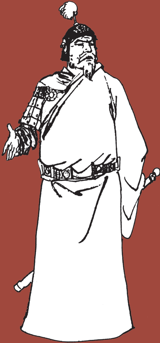
ເຢີຍວເກົ້າ