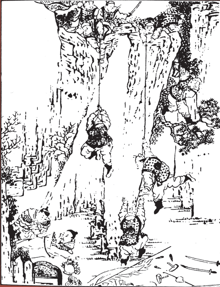
๓๖๓ ๓๖๓ เตงงายบุทเชกทีทตามเส้หนทางฮิมเป้ง