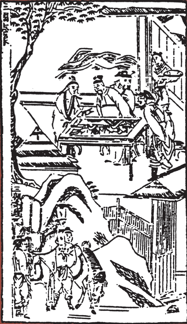
ขงเบ้งมีเสวาทะห์แผนขุทศตาศตริให้ใส่่าปีฟง