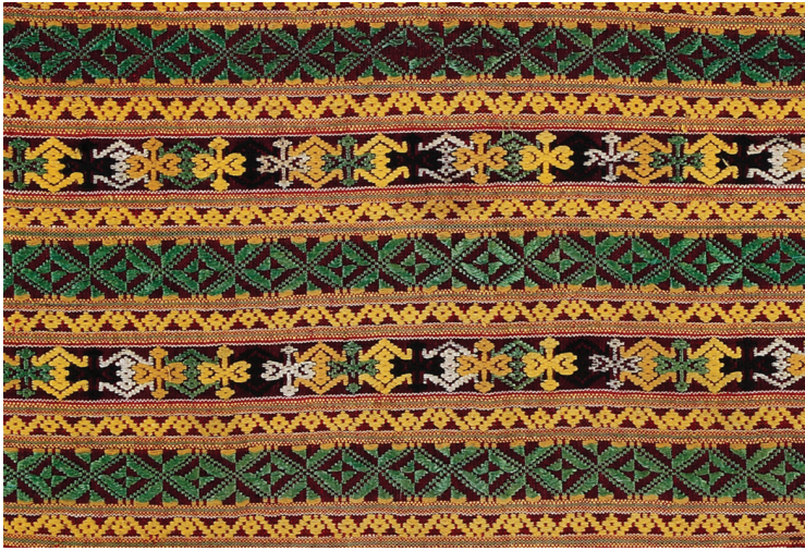
ลายคนหรือลายกบ ลวดลายอัตลักษณ์ของอาเซียนลุ่มน้ำโขง

ทุกเรื่องสอดแทรกสาระเรื่องผ้าไว้อย่างน่าชื่นชม หลายตอนเป็นเรื่องราวที่ไม่อาจพบพานได้ในปัจจุบัน เมื่ออ่านแล้วจะพบความแยบยลในเรื่องการทอผ้า ที่ผู้ใช้ยกย่องในความสามารถและภูมิปัญญาของผู้ทอ