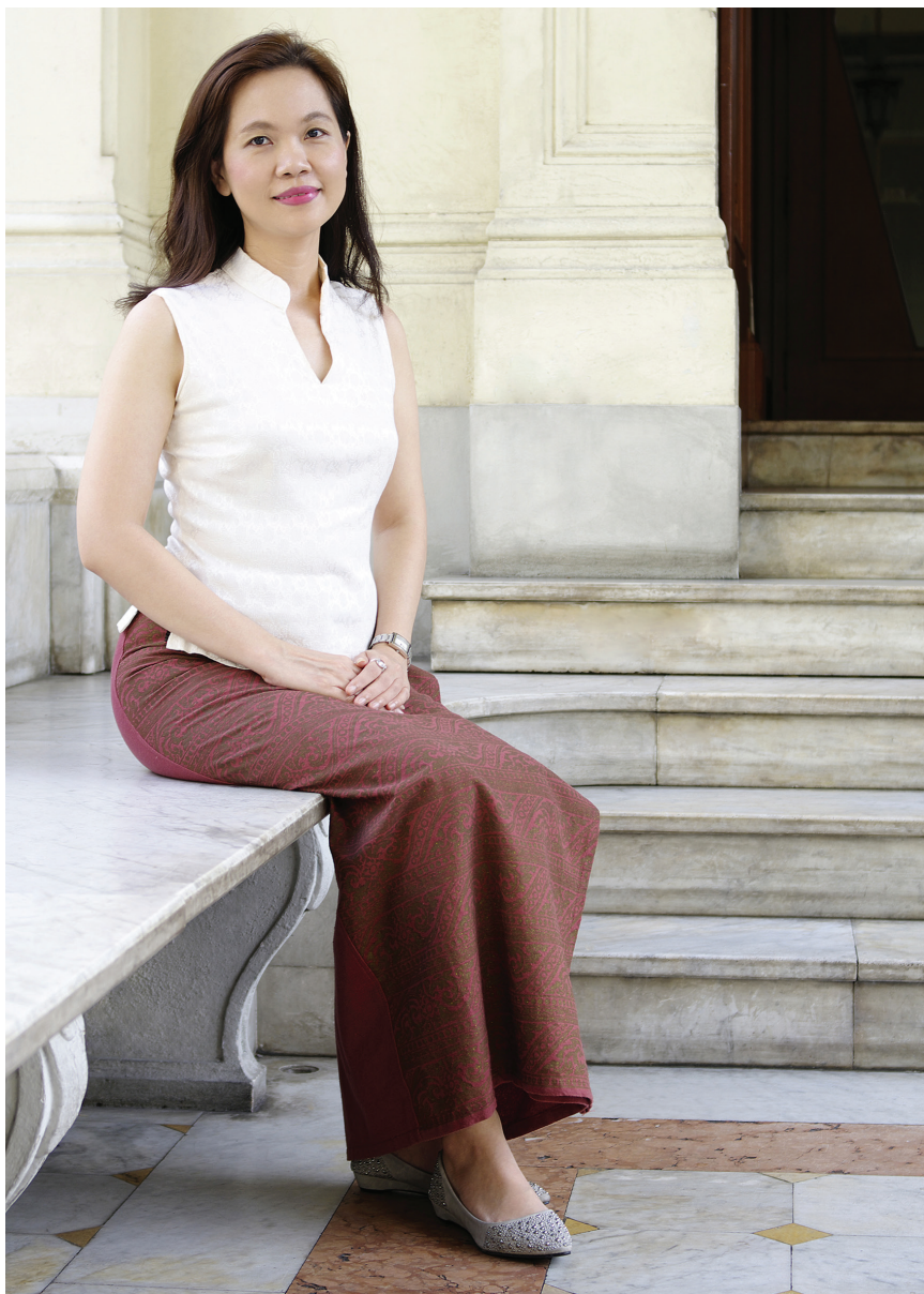
ผ้าทอไม่ล้าสมัย เพราะดัดแปลงให้สวมใส่ได้งามสง่า