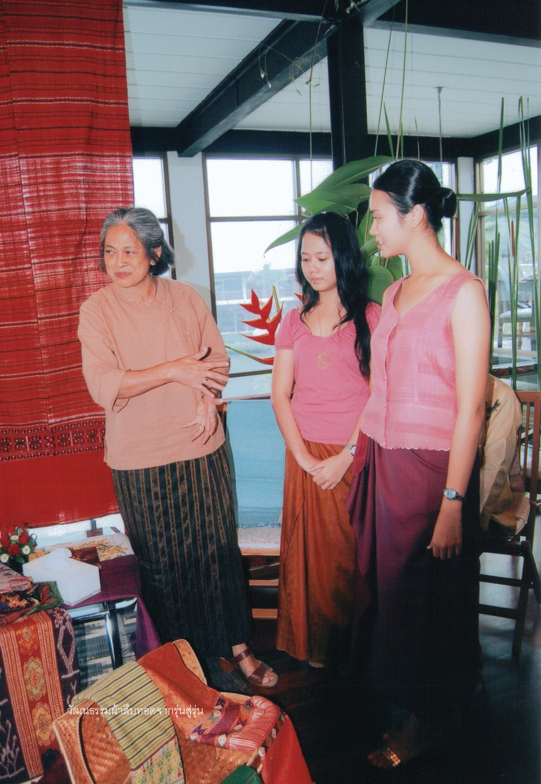
วัฒนธรรมผ้าสีบทอดจากรุ่นสู่รุ่น