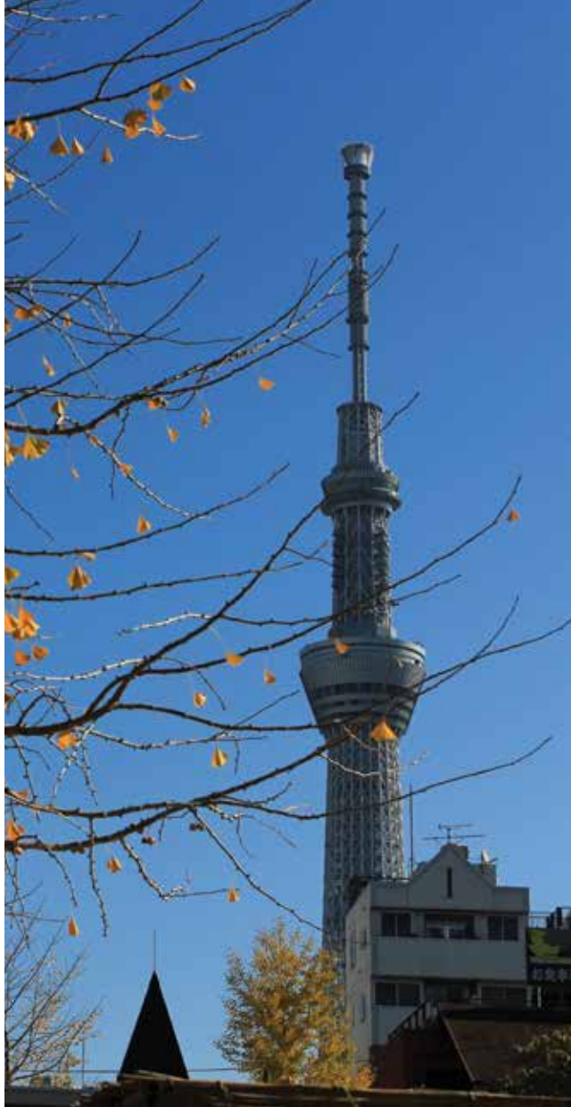
โตเกียว สกายทรี