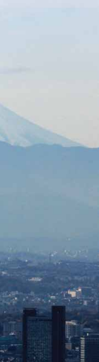
ภูเขาไฟฟูจิ ในวันที่โตเกียวห่อหุ้มฟ้าแจ่มใส