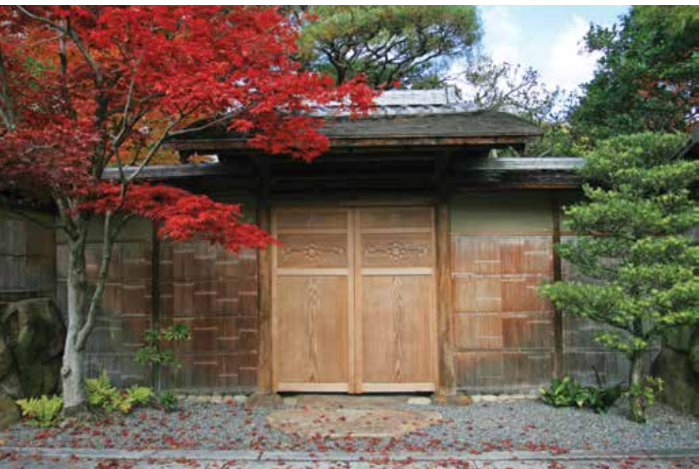
บ้านสไตล์ย้อนยุคที่ยังมีอยู่ในปัจจุบัน ณ เมืองเกียวโต