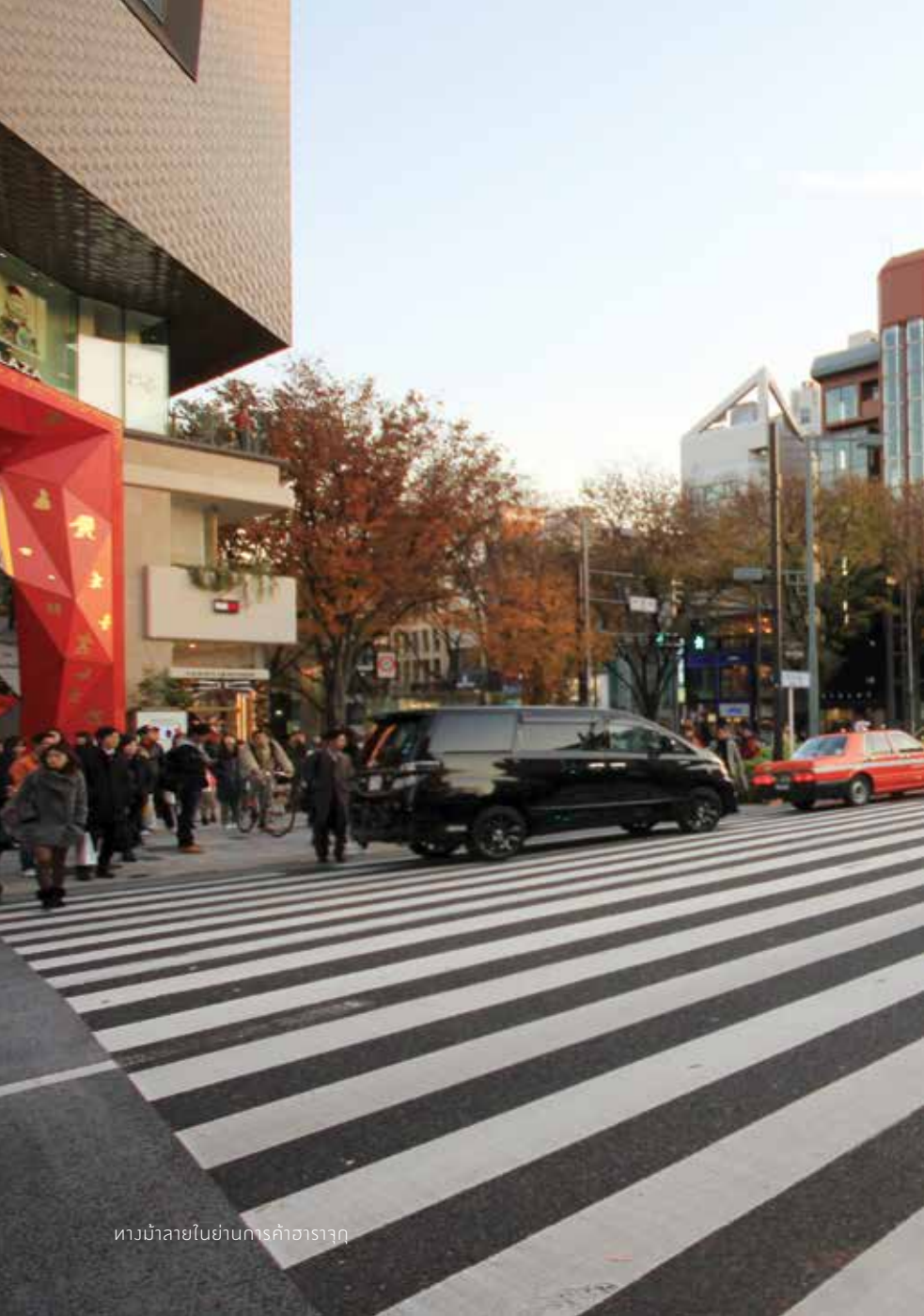
ทางม้าลายในย่านการค้าฮาราจุกุ