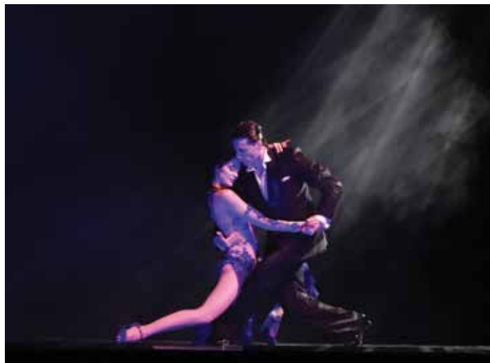
นักเต้นแทงโกแสดงลีลาอย่างอ่อนช้อยแต่ทรงพลัง