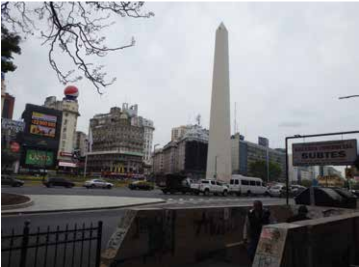
ทางลงสู่สถานีรถไฟใต้ดิน

การเดินทางไปแอนตาร์กติกาไปได้หลายเส้นทางแล้วแต่บริษัทนำเที่ยวที่เลือกใช้ บางบริษัทอาจไปทางนอร์เวย์ ชิลี อาร์เจนตินา หรือนิวซีแลนด์ แม้แต่จากประเทศเดียวกันอย่างอาร์เจนตินาเอง ยังเลือกไปได้หลายเส้นทาง แล้วแต่ว่าจะเลือกไปตรงไหนบ้าง บางคนอาจไปขึ้นเรือที่เมืองอุชูอาเอีย (Ushuaia) ล่องเป็นวงมาสิ้นสุดที่บัวโนสไอเรส (Buenos Aires) หรือบางที่อาจขึ้นเรือที่บัวโนสไอเรส แล้วไปสิ้นสุดอุชูอาเอียก็ได้ บางคนอาจเริ่มจากอุชูอาเอียแล้ววนไปจบที่ชิลีก็มี หรือเริ่มจากอุชูอาเอียแล่นเรือไปชมเพนกวิน แมวน้ำ แบบทริปลั้นๆ วันเดียวแล้วกลับมาที่เดิมก็ได้เช่นกัน