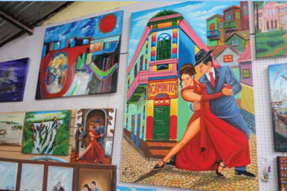
ร้านขายภาพวาด ของฝากจากอาร์เจนตินา