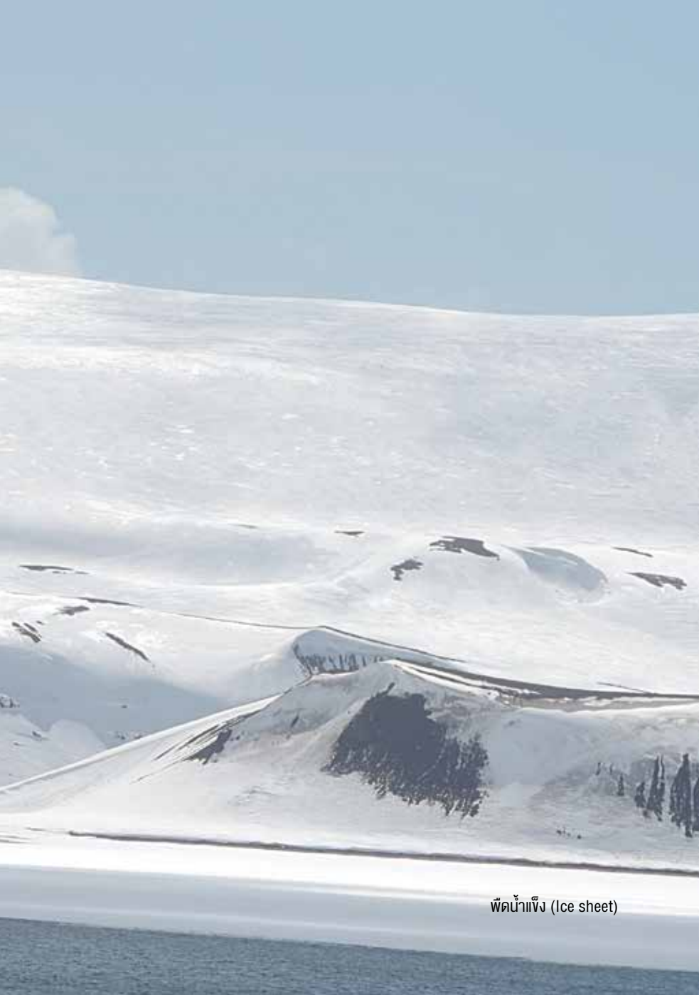
พืดน้ำแข็ง (Ice sheet)