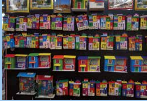
แม่เหล็กคามินโตจำลอง ของที่ระลึกสำหรับนักท่องเที่ยว

ศิลปะ มาวาดรูป สูดท้ายจึง กลายเป็นย่านที่มีชีวิตชีวา มากๆ เราจะได้ยินเสียงเพลง อาร์เจนตินาแกกโกลดเวลา จนแทบจะเรียกได้ว่า มันซึม เข้าไปในทุกอณูอากาศ ทุก ลมหายใจของคนที่นี่ และ ร้านอาหารเกือบทุกร้านต้องมี การโชว์การเต้นแทงโกทุกๆ 10-15 นาที