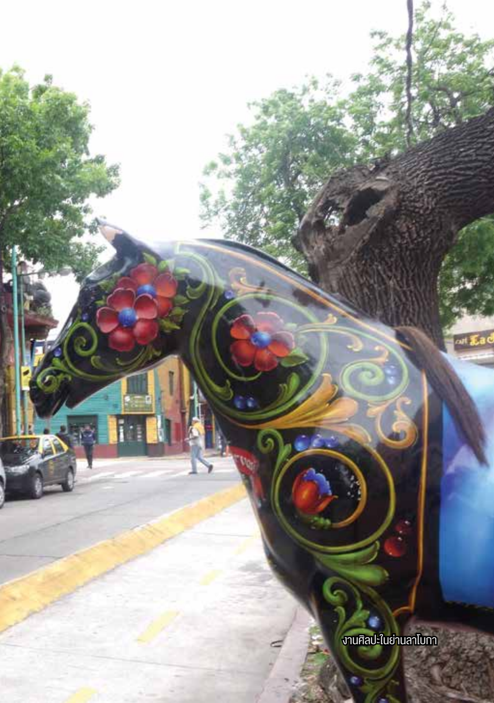
งานศิลปะในย่านลาโวกา