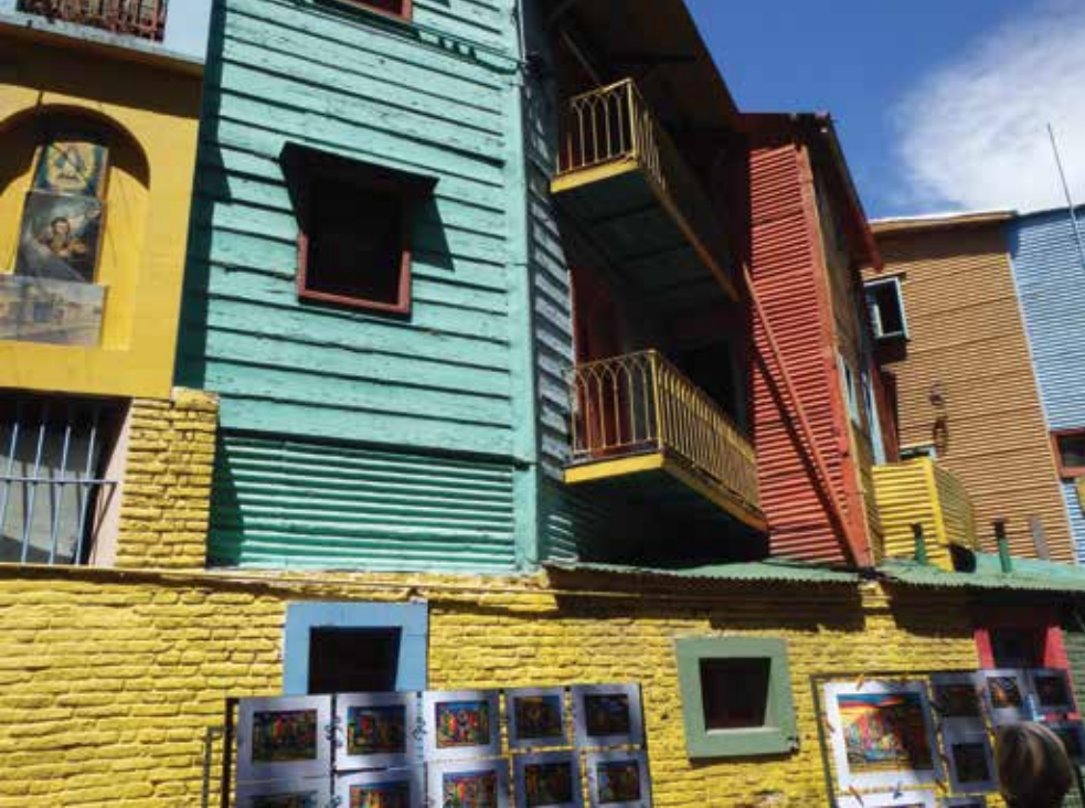
บ้านหลากสีสลับบนถนนคามินิโต

นอกจากสุสานลาเรโคเลตาแล้ว ยังมีอีกสถานที่หนึ่งเรียกกันว่า ถนนคามินิโต (Caminito) แห่งย่านลาโบกา (La Boca) ซึ่งนักท่องเที่ยวไม่ควรพลาด ถนนเส้นนี้มีสีสันและความสนุกสนานตลอดเวลา มีชื่อเสียงมากพอๆ กับถนนข้าวสารบ้านเรา ในอดีตเคยเป็นย่านของผู้ใช้แรงงาน สร้างที่พักกันแบบง่ายๆ เป็นแผ่นไม้บ้าง ลังกะสีบ้าง นำมาปะติดปะต่อตามมีตามเกิด จนสุดท้ายมีศิลปินคนหนึ่งมองดูแล้วรู้สึกว่่า ทำงาน