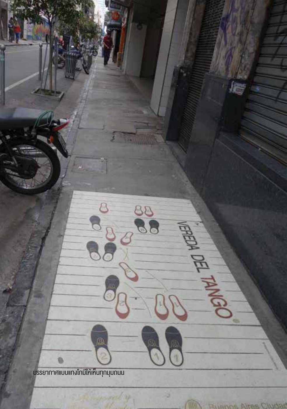
บรรยากาศแบบแทงโกมีให้เห็นทุกมุมถนน