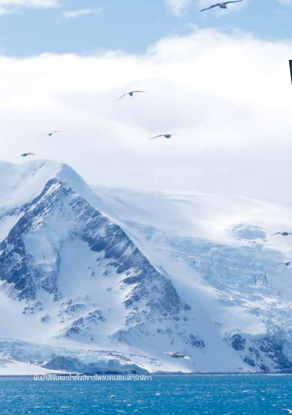
ผืนน้ำสีเข้มและน้ำแข็งสีขาวโพลนของแอนตาร์กติกา