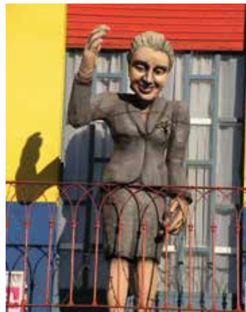
หุ่นรูป เอิวิตา เปรอง

นอกจากสุสานลาเรโคเลตาแล้ว ยังมีอีกสถานที่หนึ่งเรียกกันว่า ถนนคามินิโต (Caminito) แห่งย่านลาโบกา (La Boca) ซึ่งนักท่องเที่ยวไม่ควรพลาด ถนนเส้นนี้มีสีสันและความสนุกสนานตลอดเวลา มีชื่อเสียงมากพอๆ กับถนนข้าวสารบ้านเรา ในอดีตเคยเป็นย่านของผู้ใช้แรงงาน สร้างที่พักกันแบบง่ายๆ เป็นแผ่นไม้บ้าง ลังกะสีบ้าง นำมาปะติดปะต่อตามมีตามเกิด จนสุดท้ายมีศิลปินคนหนึ่งมองดูแล้วรู้สึกว่่า ทำงาน