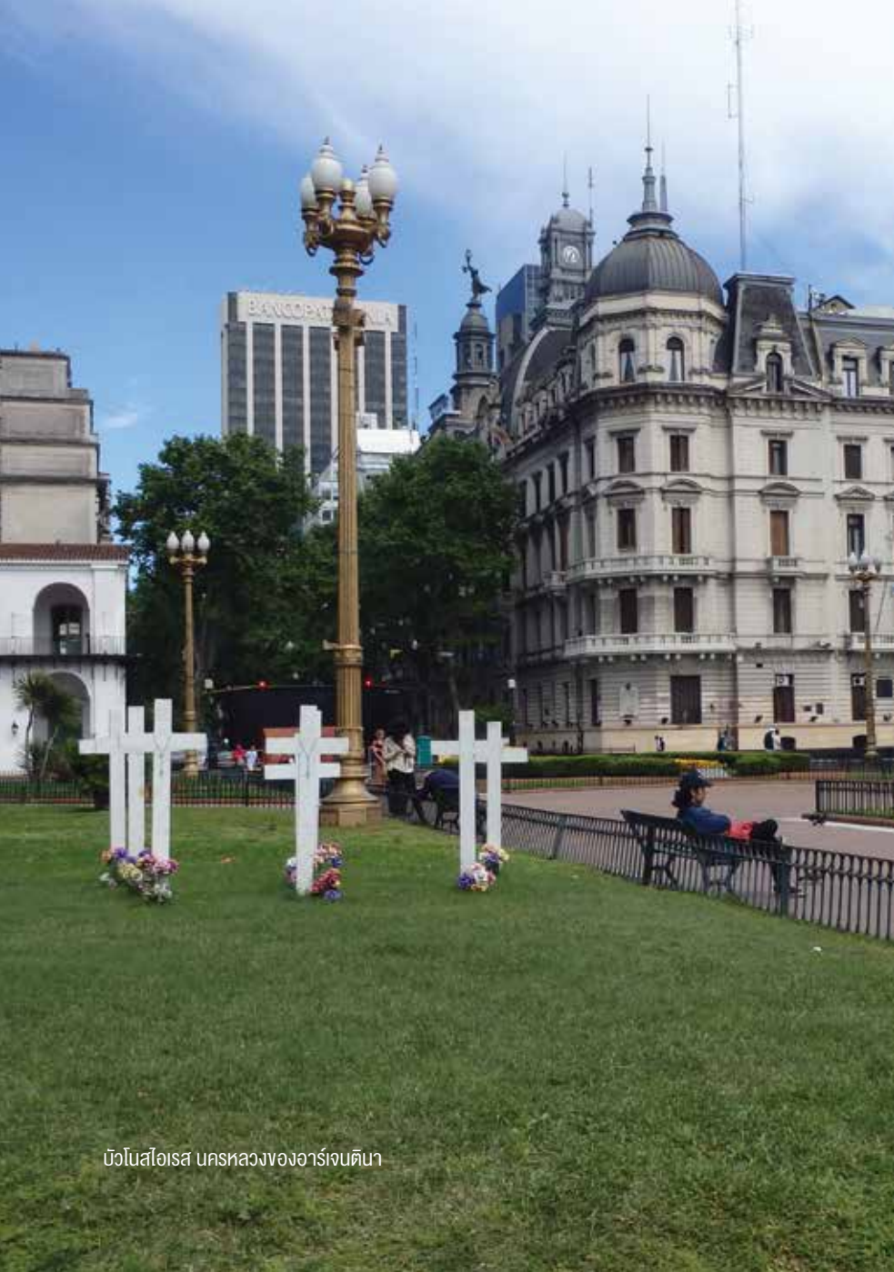
บิวโนสไอเรส นครหลวงของอาร์เจนตินา