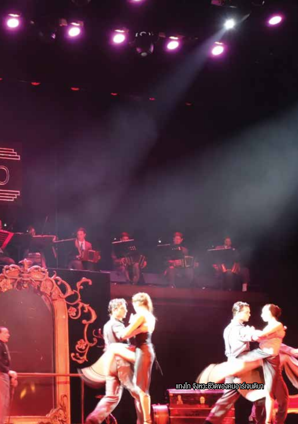
แกงโก จังหวะชีวิตของคอนอาร์เจนตินา