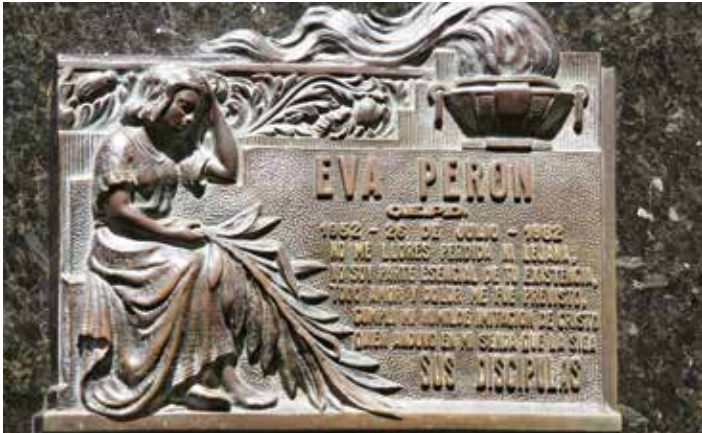
ป้ายหน้าสุสานของ เอวา เปรอน

นอกจากการชมแทงโกแล้ว สถานที่สำคัญที่ต้องไปเยือนให้ได้เมื่อมาถึงบัวโนสไอเรส คือ สุสานลาเรโคเลตา (La Recoleta) สุสานแห่งนี้ถือเป็นสุสานไฮโซ เพราะที่ดิน (สำหรับคนตาย) ตรงนี้ราคาสูงลิบลัว ใครก็ตามที่ได้มาฝังร่างที่ลาเรโคเลตาก็ถือว่าไม่ธรรมดา ถ้าไม่ใช่ผู้นำประเทศ ก็ต้องเป็นมหาเศรษฐี บุคคลสำคัญของอาร์เจนตินาคคนหนึ่งที่ได้รับการฝังร่างไว้ที่นี่ก็คือ เอวิตา เปรอง (Evita Peron) อดีตสตรีหมายเลขหนึ่งของอาร์เจนตินา หรือที่ชาวอาร์เจนตินาเรียกว่า เอวา เปรอน (Eva Peron) ผู้ที่ชีวิตของเธอเคยถ่ายทอดเป็นภาพยนตร์เรื่อง เอวิตา (Evita) ในปี 1996 ถ้าใครเคยชมภาพยนตร์เรื่องนี้มาก่อน คงไม่ลืมฉากที่มาดอนนาร้องเพลง “ตอนที่ครายฟอรั่มอาร์เจนตินา” (Don't Cry for Me Argentina) ไว้อย่างได้อารมณ์