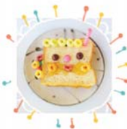
ขนมฉลองวันเกิด