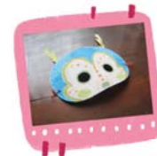
หน้ากากยอดมนุษย์