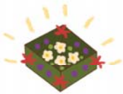
กระตงน้อยเพื่อสิ่งแวดล้อม