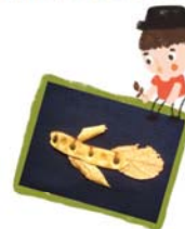
จิกซอวิไบไม้