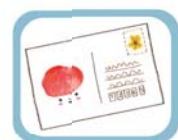
ส.ค.ส. สุดพิเศษ