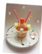
ไอศกรีมน่ารัก