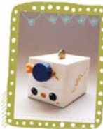
กระปุกกุกกิก