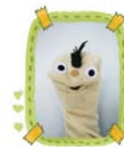
หุ่นมือเพื่อนรัก