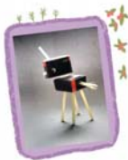
กล่องกระดาษแปลงกาย