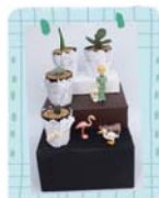
มุมสบายใจ