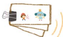
หนังสือการ์ตูนพukup