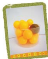
เกมสนุกปลูกสมอ