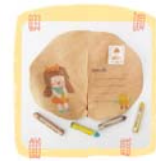
ใบไม้ส่งความสุข