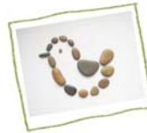
ก้อนหินแสนสนุก