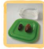
เจ้าตัวดูดน้ำ