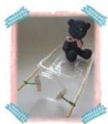
เรือใบพัด