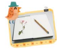
สมุดบันทึกดอกไม้แห้ง