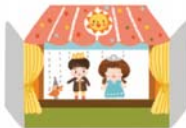
โรงละครจำลอง