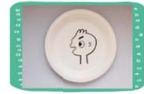
งานเชิวยิ้ม