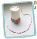
กระบอกเสียงพิศวง