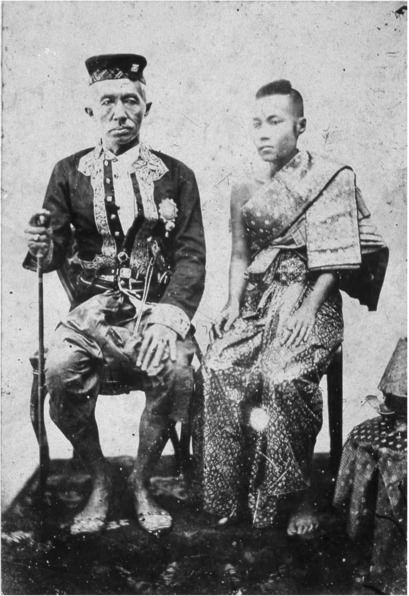
พระบรมรูปพระบาทสมเด็จพระจอมเกล้าเจ้าอยู่หัว ทรงฉายกับสมเด็จพระนางเจ้าทิพเกศภักดี (สมเด็จพระเทพ-)