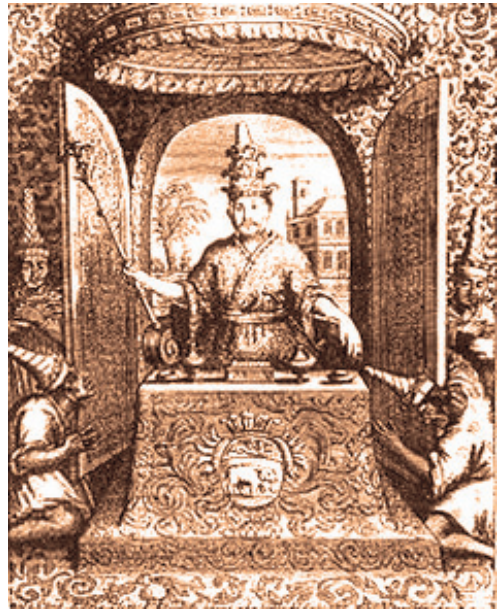
สมเด็จพระนารายณ์มหาราช ครึ่งเสด็จออกรบ คณะทูต ฝีมือช่างวาดฝรั่งเศส

ต่อมา พระเจ้าปราสาททองให้มีพระราชพิธีโสกันต์ (โกนจุก) แล้วให้สมเด็จพระนารายณ์ ทรงผนวชเป็นสามเณร ณ วัดพระศรีสรรเพชญ์ ไปประทับอยู่กับพระพรหมมุนีที่วัดปากน้ำ ประสบได้ศึกษาทั้งพุทธศาสตร์และไสยศาสตร์ รวมทั้งทรงสร้างเทวรูปหลายองค์