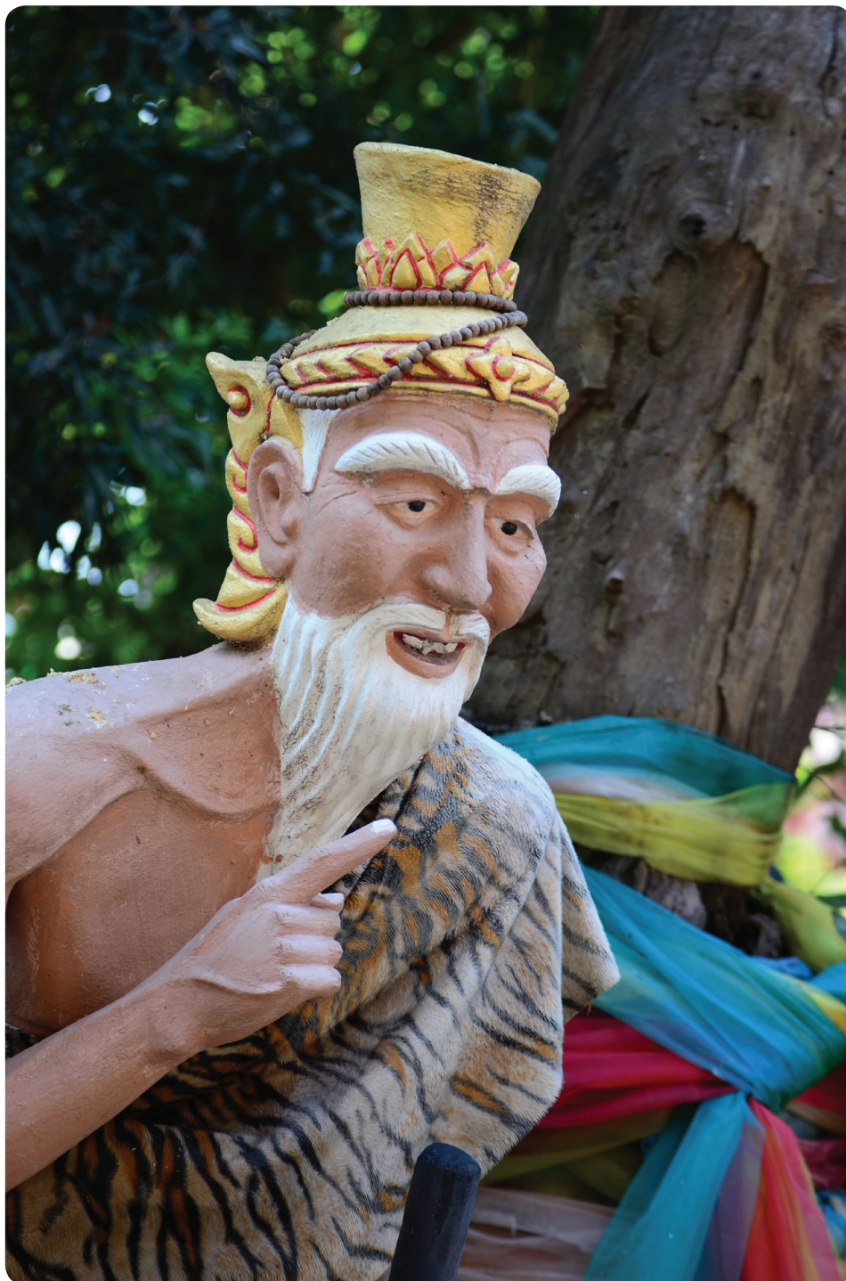
พระดาบส หรือ พระฤๅษี ผู้ถ่ายทอดวิชาความรู้ในสมัยโบราณ