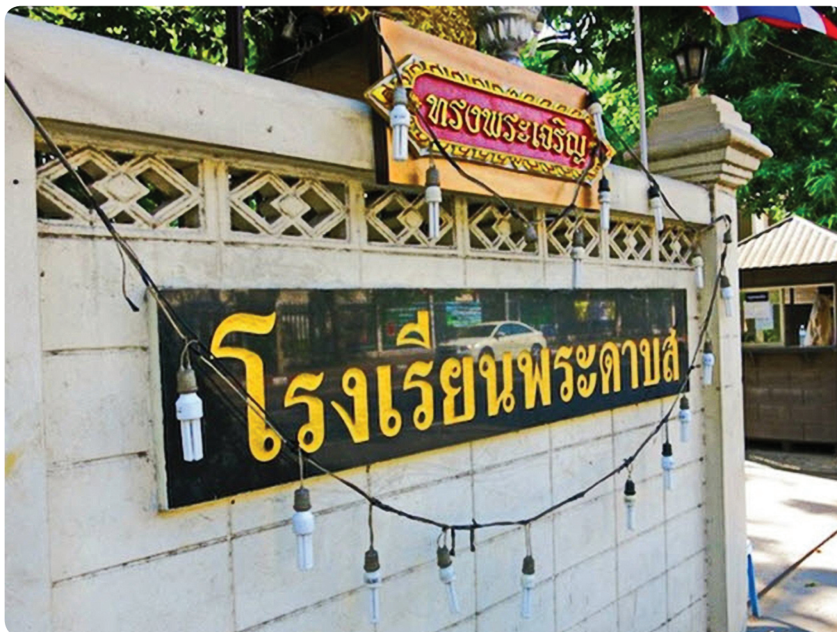
โรงเรียนพระดาบส เปิดสอนวิชาชีพแก่นักเรียนที่มีความตั้งใจแต่ขาดทุนทรัพย์