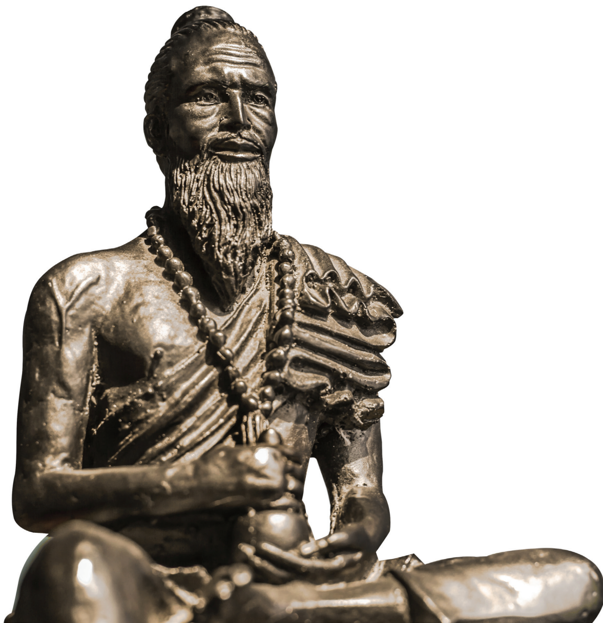
ชีวกโกมารภัจจ์ อาสารับใช้พระอาจารย์แทนค่าเล่าเรียนวิชา ต่อมาได้รับยกย่องเป็นบรมครูแห่งการแพทย์แผนโบราณ