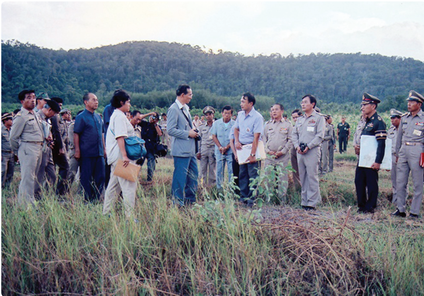
พระบาทสมเด็จพระมหาภูมิพลอดุลยเดชมหาราช บรมนาถบพิตร พร้อมด้วยสมเด็จพระกนิษฐาธิราชเจ้า กรมสมเด็จพระเทพรัตนราชสุดาฯ สยามบรมราชกุมารี เสด็จพระราชดำเนินทรงติดตามการดำเนินงานของศูนย์ศึกษาการพัฒนาห้วยฮ่องไคร้อันเนื่องมาจากพระราชดำริ อำเภอดอยสะเก็ด จังหวัดเชียงใหม่