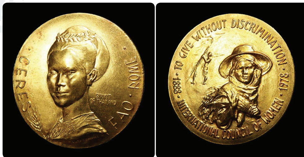
เหรียญเซเรส (Ceres Medal) เป็นรางวัลที่ทางองค์การอาหารและเกษตรแห่งสหประชาชาติ (FAO) มอบแด่สุภาพสตรีที่มีส่วนช่วยพัฒนาความเป็นอยู่ของสตรีทั้งปวง

งานพัฒนาเป็นงานที่ต่อสู้กับความขาดแคลน ทุกข์ยาก ความยากจน และความหวือหวา อันเป็นสภาวะทางกายภาพที่มองเห็นได้อย่างชัดเจน มิใช่ต่อสู้กับความคิดความเชื่ออันเป็นนามธรรม และเป็นงานระยะยาวที่ต้องทำอย่างต่อเนื่อง ดังเช่นที่ปรากฏในข้อความที่สลักในเหรียญที่ระลึก ‘เซเรส’ (CERES) อันเป็นเหรียญที่องค์การอาหารและเกษตรแห่งสหประชาชาติ (Food and Agriculture Organization of the United Nations) ทูลเกล้าฯ ถวายสมเด็จพระนางเจ้าสิริกิติ์ พระบรมราชินีนาถ พระบรมราชชนนีพันปีหลวง เมื่อ พ.ศ. ๒๕๒๑ ว่า “ให้โดยไม่เลือกที่รักมักที่ชัง” (To give without discrimination) โดยทรงหมายความว่า จะต้องเลือกสรรสิ่งที่ดีที่สุดให้คนโดยถ้วนหน้า