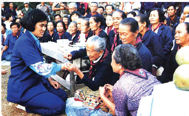
การมีมนุษยสัมพันธ์ เป็นหนึ่งในแนวพระราชดำริในการทรงงานของ สมเด็จพระกนิษฐาธิราชเจ้า กรมสมเด็จพระเทพรัตนราชสุดาฯ สยามบรมราชกุมารี

พระองค์ได้พระราชทานแนวทางการดำเนินงาน เพื่อให้ นักพัฒนานำไปใช้เป็นเคล็ดลับในการทำงาน ได้แก่