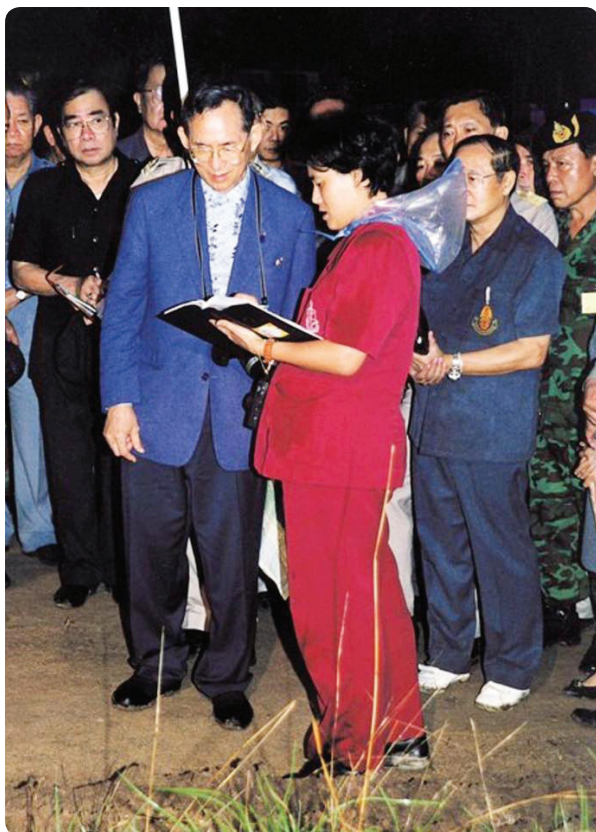
พระบาทสมเด็จพระมหาภูมิพลอดุลยเดชมหาราช บรมนาถบพิตร พร้อมด้วยสมเด็จพระกนิษฐาธิราชเจ้า กรมสมเด็จพระเทพรัตนราชสุดาฯ สยามบรมราชกุมารี เสด็จพระราชดำเนินทรงติดตามการดำเนินงานของศูนย์ศึกษาการพัฒนาห้วยทรายอันเนื่องมาจากพระราชดำริ อำเภอสัตหีบ จังหวัดเพชรบุรี