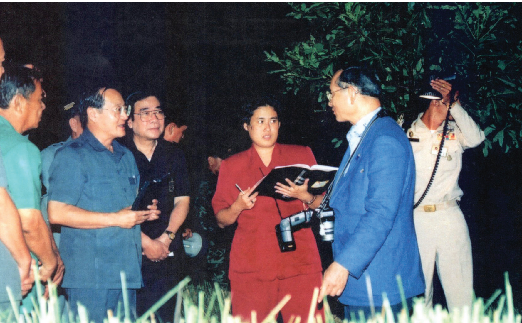
สมเด็จพระกนิษฐาธิราชเจ้า กรมสมเด็จพระเทพรัตนราชสุดาฯ สยามบรมราชกุมารี ทรงดำเนินงานด้านการพัฒนาตามแนวพระราชดำริของสมเด็จพระบรมชนกนาถและสมเด็จพระบรมราชชนนี