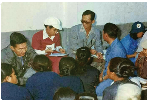
พระบาทสมเด็จพระมหาภูมิพลอดุลยเดชมหาราช บรมนาถบพิตร พร้อมด้วยสมเด็จพระกนิษฐาธิราชเจ้า กรมสมเด็จพระเทพรัตนราชสุดาฯ สยามบรมราชกุมารี เสด็จพระราชดำเนินทรงติดตามการดำเนินงาน ของโรงงานหลวงอาหารสำเร็จรูปที่ ๑ (ฝาง) จังหวัดเชียงใหม่

From Her experience seeing the way of life of people living across each region of Thailand, HRH Princess Maha Chakri Sirindhorn learned how to: work with Her people, understand their needs, and address them appropriately, given the available resources in each location. Thus, She is able to leverage Her knowledge and experience to manage a wide variety of projects including those which have been Royally initiated (the so-called Royal Projects) and given over to the management of other institutions or a board of directors. Many of which have been focused on bettering the quality of life of the Thai people through improving: nutrition, education, natural resources management and environmental conservation, cultural arts, and information and communications technology (ICT).