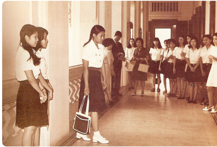
วันปฐมนิเทศที่คณะอักษรศาสตร์ ๗ มิถุนายน พ.ศ. ๒๕๑๖

กิจกรรมอื่นๆ ที่สมเด็จพระกนิษฐาธิราชเจ้า กรมสมเด็จพระเทพรัตนราชสุดาฯ สยามบรมราชกุมารี ทรงเข้าร่วม คือ ทรงสมัครเป็นสมาชิกชมรมดนตรีไทยและชมรมวรรณศิลป์ ของสโมสรนิสิตจุฬาลงกรณ์มหาวิทยาลัย ทรงเป็นสมาชิก ชมรมภาษาไทย ชมรมภาษาตะวันออก และชมรมประวัติศาสตร์ในคณะอักษรศาสตร์ ทั้งยังทรงเป็นกองบรรณาธิการวารสาร อักษรศาสตร์พิจารณา ของชุมนุมวิชาการคณะอักษรศาสตร์อีกด้วย ในบางครั้งก็พระราชทานบทพระราชนิพนธ์หลายเรื่องลงพิมพ์ในวารสารดังกล่าว เช่นเรื่อง การเดินทางไปร่วมพิธีพระบรมศพพระเจ้ากุสตาฟที่ ๖ ออดอล์ฟแห่งประเทศสวีเดน และร้อยกรองต่าง ๆ