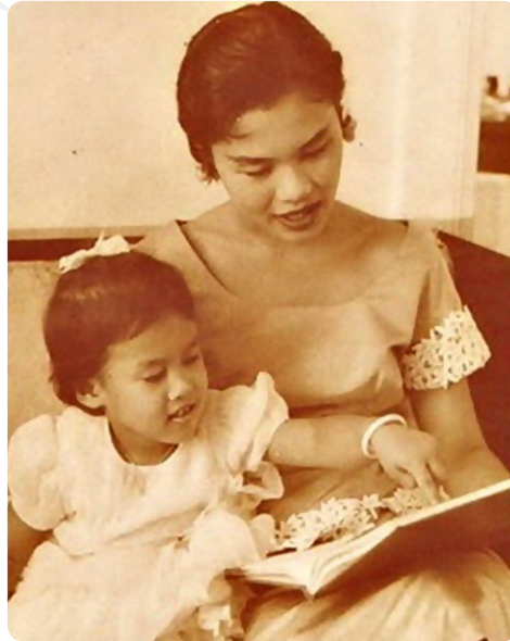
สมเด็จพระนางเจ้าสิริกิติ์ พระบรมราชินีนาถ พระบรมราชชนนีพันปีหลวง ทรงหัดให้พระราชโอรสพระราชธิดาอ่านหนังสือวรรณคดีไทยตั้งแต่ยังทรงพระเยาว์

HM Queen Sirikit cultivated a love of reading in Her son and daughters from early childhood. She taught Them to read the great works of Thai literature, like Phra Apaimani , I-nao (Panji) , and the Ramayana , and They could even recite some. She also bought a lot of books including children's books, books about history, geography, historical figures, Buddhism, art & culture, and newspapers, and read to Her children. She encouraged Her children to create Their own libraries, collect books, and visit museums. She also hired tutors to teach Her children. HM Queen Sirikit played a key role in Her children's academic success.