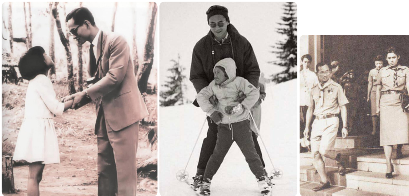
พระบาทสมเด็จพระมหาภูมิพลอดุลยเดชมหาราช บรมนาถบพิตร ต้นแบบแห่งการเรียนรู้ ของสมเด็จพระกนิษฐาธิราชเจ้า กรมสมเด็จพระเทพรัตนราชสุดาฯ สยามบรมราชกุมารี