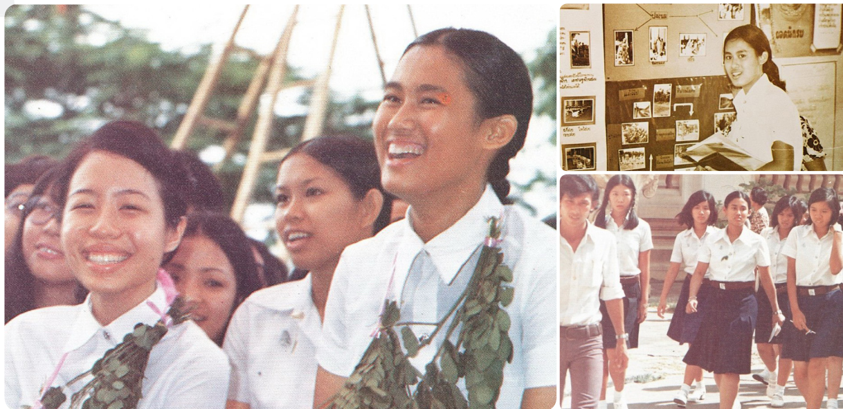
สมเด็จพระกนิษฐาธิราชเจ้า กรมสมเด็จพระเทพรัตนราชสุดาฯ สยามบรมราชกุมารี ขณะทรงเป็นนิสิตใหม่ คณะอักษรศาสตร์ จุฬาลงกรณ์มหาวิทยาลัย รุ่น ๔๑