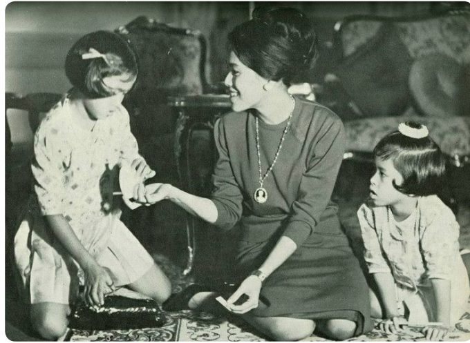
สมเด็จพระนางเจ้าสิริกิติ์ พระบรมราชินีนาถ พระบรมราชชนนีพันปีหลวง ทรงปลูกฝังให้พระราชโอรสพระราชธิดาทรงรักการอ่านหนังสือตั้งแต่ทรงพระเยาว์

สมเด็จพระนางเจ้าสิริกิติ์ พระบรมราชินีนาถ พระบรมราชชนนีพันปีหลวง ทรงปลูกฝังให้พระราชโอรสพระราชธิดาทรงรักการอ่านหนังสือตั้งแต่พระชนมายุเพียง ๖-๗ พรรษา ทรงใช้วิธีหัดให้ทรงอ่านหนังสือวรรณคดีไทยหลายเรื่อง เช่น พระอภัยมณี อิเหนา รามเกียรติ์ จนทรงท่องจำบทกลอนในวรรณคดีเหล่านี้ได้หลายบท นอกจากนี้ยังทรงซื้อหนังสืออื่นๆ มาทรงอ่าน แล้วทรงเล่าพระราชทานพระราชโอรสพระราชธิดา เป็นต้นว่าหนังสือนิทานสำหรับเด็ก หนังสือประวัติศาสตร์ ภูมิศาสตร์ ประวัติบุคคลสำคัญ พุทธศาสนา เรื่องเกี่ยวกับศิลปะและวัฒนธรรมทั้งของไทยและต่างประเทศ หนังสือพิมพ์ ทรงสนับสนุนการจัดทำห้องสมุด สะสมหนังสือ โปรดให้เสด็จไปทอดพระเนตรพิพิธภัณฑ์สถานต่างๆ ด้านการศึกษา เล่าเรียนทรงจัดหาครูอาจารย์ผู้ทรงคุณวุฒิมาถวายพระอักษรวิชาต่างๆ