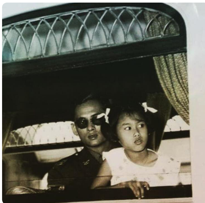
พระบาทสมเด็จพระมหาภูมิพลอดุลยเดชมหาราช บรมนาถบพิตร และสมเด็จพระนางเจ้าสิริกิติ์ พระบรมราชินีนาถ พระบรมราชชนนีพันปีหลวง เสด็จพระราชดำเนินโดยขบวนรถไฟพระที่นั่งไปทรงเยี่ยมเยียนราษฎรในจังหวัดกาญจนบุรี เมื่อวันที่ ๒๖ ตุลาคม พ.ศ. ๒๕๐๖ โดยสมเด็จพระกนิษฐาธิราชเจ้า กรมสมเด็จพระเทพรัตนราชสุดาฯ สยามบรมราชกุมารี โดยเสด็จในการนี้ด้วย