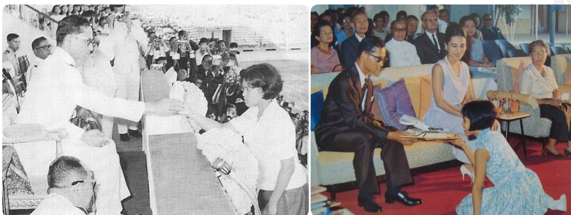
สมเด็จพระกนิษฐาธิราชเจ้า กรมสมเด็จพระเทพรัตนราชสุดาฯ สยามบรมราชกุมารี (เมื่อทรงพระเยาว์) รับพระราชทานรางวัลเรียนดีจากพระบาทสมเด็จพระมหาภูมิพลอดุลยเดชมหาราช บรมนาถบพิตร ในงานแสดงศิลปหัตถกรรมนักเรียน ครั้งที่ ๓๑ ณ กรีฑาสถานแห่งชาติ เมื่อวันที่ ๑ ธันวาคม พ.ศ. ๒๕๑๑