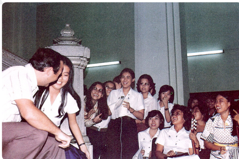
สมเด็จพระกนิษฐาธิราชเจ้า กรมสมเด็จพระเทพรัตนราชสุดาฯ สยามบรมราชกุมารี ทรงร่วมร้องเพลงในกิจกรรมส่งเสริมการเรียนรู้การสอนของภาควิชาภาษาตะวันตก