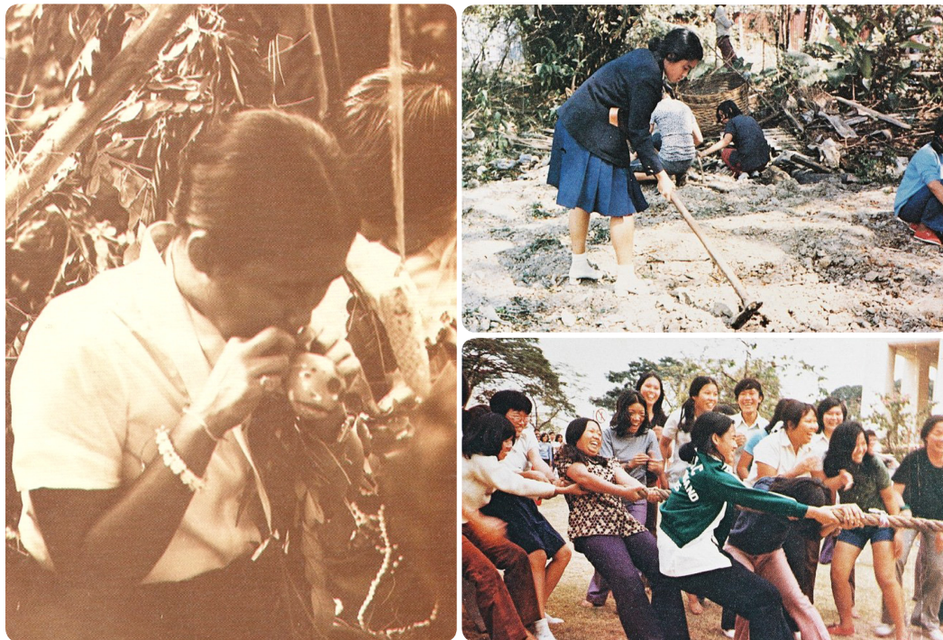
สมเด็จพระกนิษฐาธิราชเจ้า กรมสมเด็จพระเทพรัตนราชสุดาฯ สยามบรมราชกุมารี ทรงร่วมกิจกรรมในมหาวิทยาลัยอย่างไม่ถือพระองค์

HRH Princess Maha Chakri Sirindhorn wrote about Her time at the Chulalongkorn University Faculty of Arts in Tide of Consciousness .