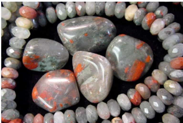
บัลด์สโตน