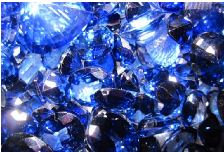
ไพฑูริย์