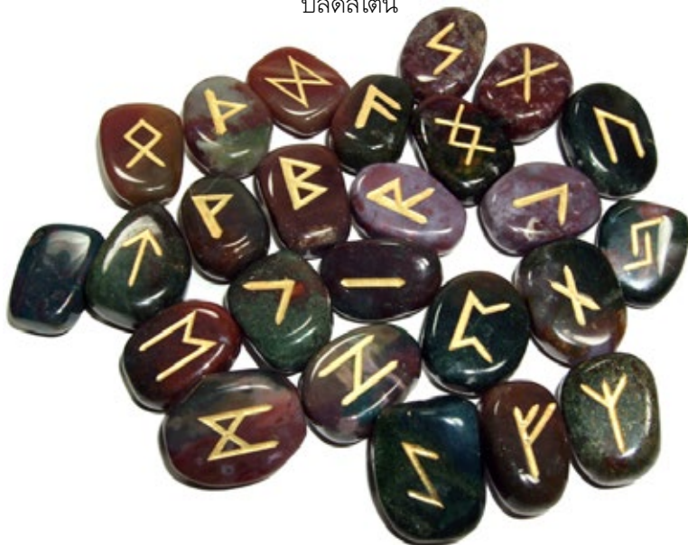
การนำหินชนิดหนึ่งมาแกะสลักตัวอักษรโบราณที่เรียกว่า รูนส์