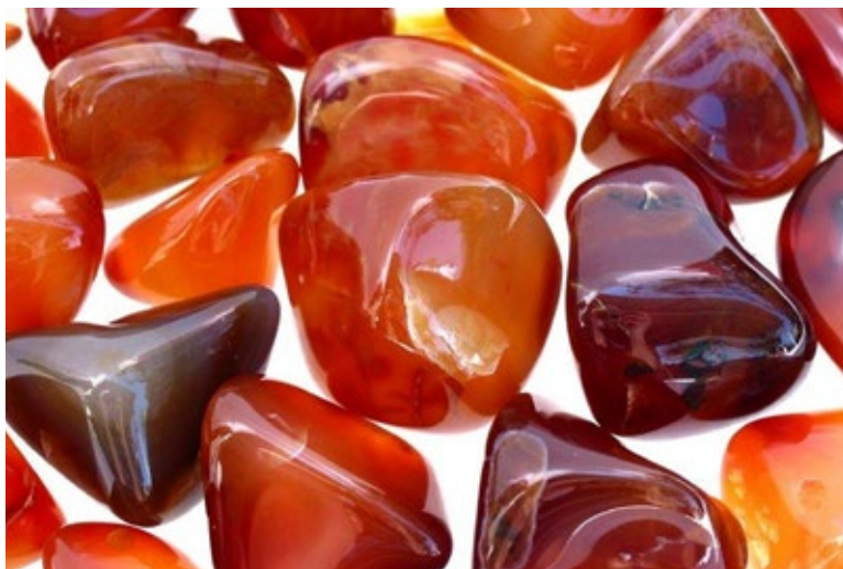
คาร์เนเลียน